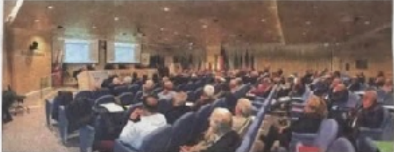
MUTUA MBA DIVI E ASSOCIATI ALLA FONDAZIONE

IL MUTUO SOCCORSO | PROMUOVE SPORT, PREVENZIONE E CURA D al calcio al tennis, dalla maratona al ciclismo, dall'equitazione all'arrampicata sportiva: la Banca dello Sport nasce per rendere democratico ed accessibile l'esercizio fisico. Il Mutuo Soccorso è lo sport cittadino, dove i leader alla base della costruzione di una società più equa e solidale. In primo luogo, attraverso la promozione del benessere personale e familiare, attraverso la pratica di attività sportive, la Banca dello Sport contribuisce a prevenire e curare le malattie, a migliorare la qualità della vita, a favorire la socializzazione e a promuovere la partecipazione attiva dei cittadini. La Banca dello Sport è un'associazione di promozione sociale che ha come scopo principale la promozione di attività sportive e ricreative per tutti, con particolare attenzione alle fasce più vulnerabili della popolazione. La Banca dello Sport è un'associazione di promozione sociale che ha come scopo principale la promozione di attività sportive e ricreative per tutti, con particolare attenzione alle fasce più vulnerabili della popolazione.